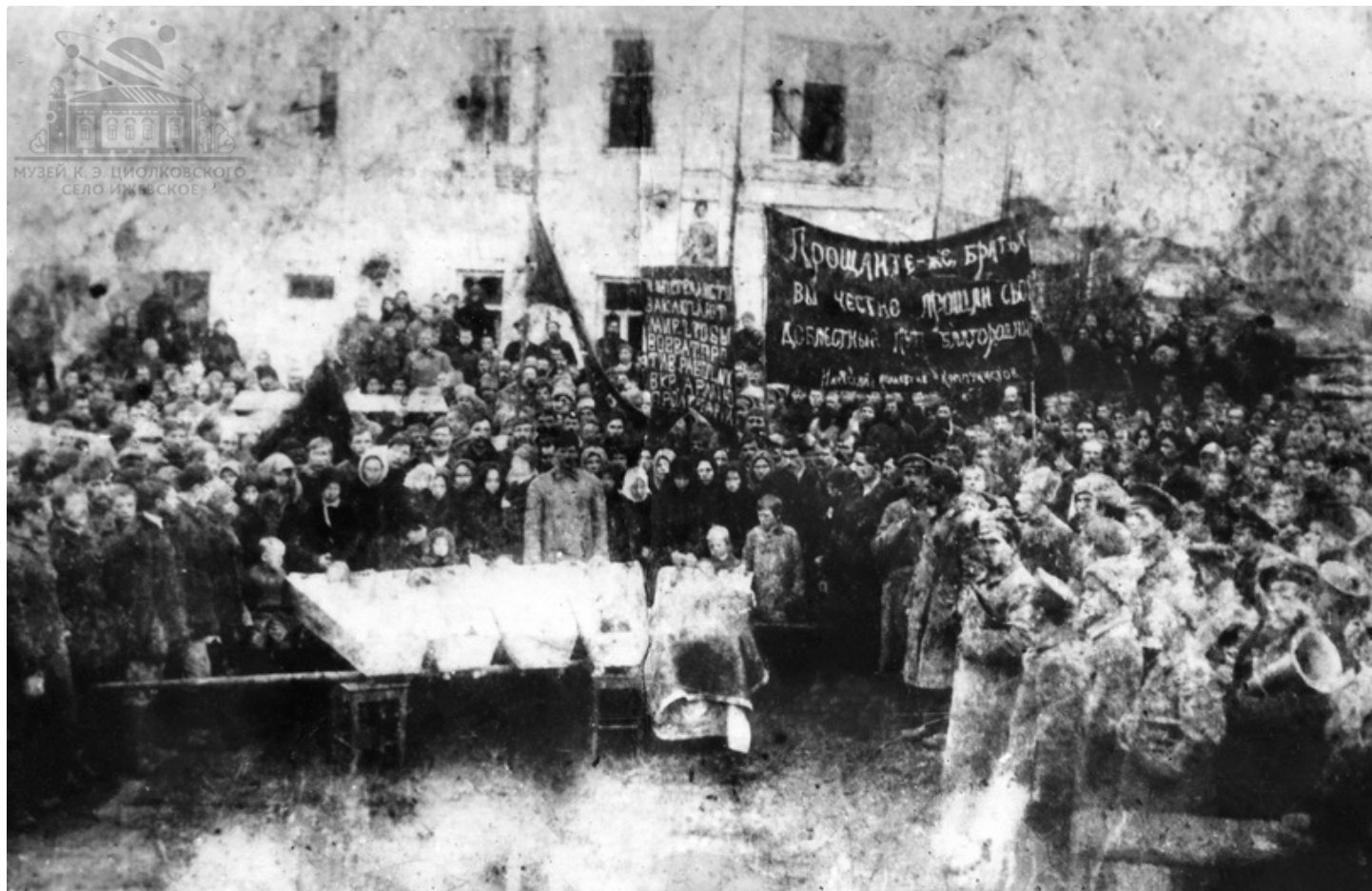
Прощание с убитыми коммунистам на Базарной площади в Ижевском. 18 ноября 1918 года.