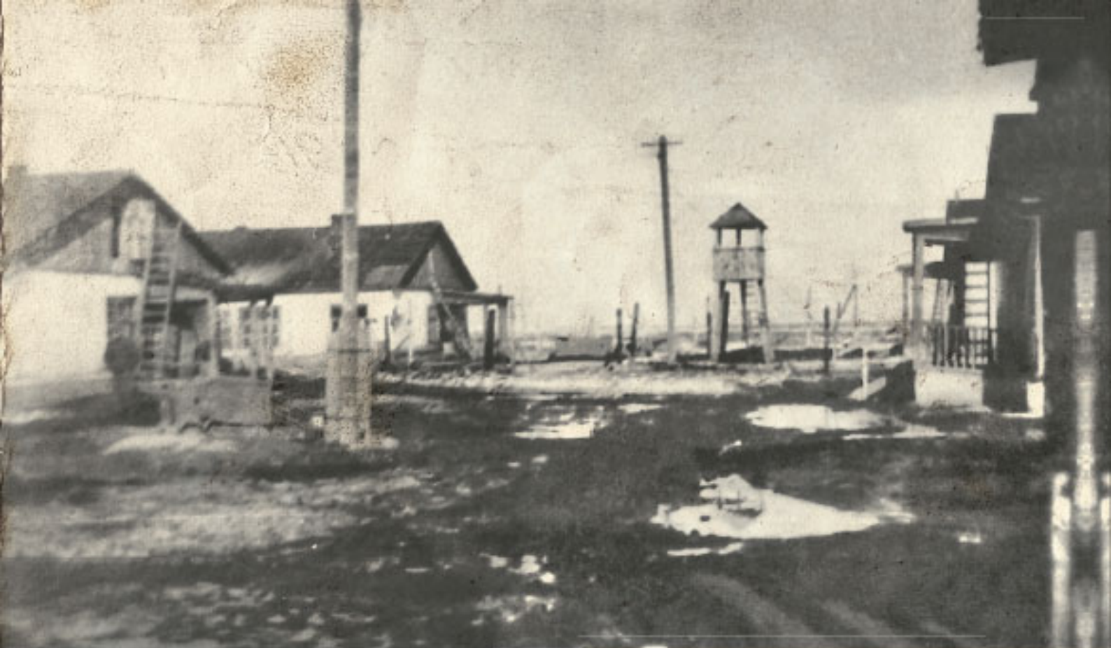
Лагерь №178, ок. 1942–1943 гг.