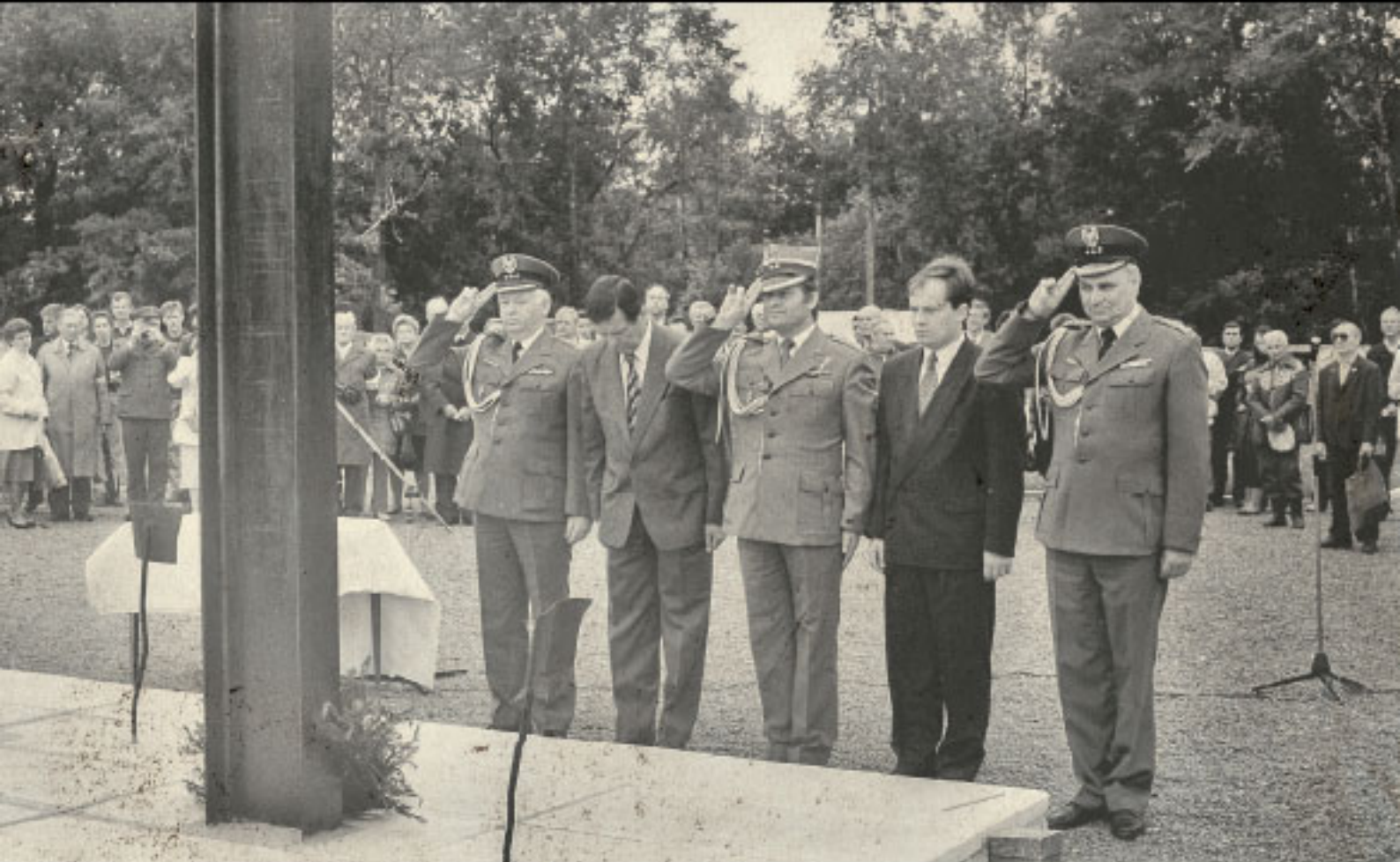
Открытие Мемориального комплекса, 1994 г.

На завершающем этапе проект также поддержали Министерство культуры Российской Федерации, администрации города Рязани и Рязанской области.