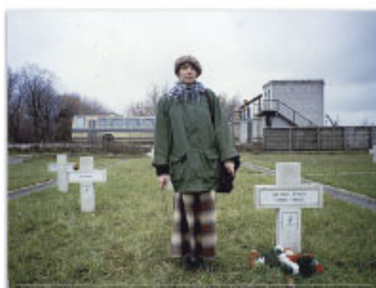
Индивидуальные захоронения польских интернированных.

Уход и благоустройство территории мемориального комплекса производится на основании межправительственных соглашений по уходу за военными могилами между Россией и Польшей, Россией и Германией. Средства на уход выделяет Немецкий народный союз по уходу за могилами жертв войны.