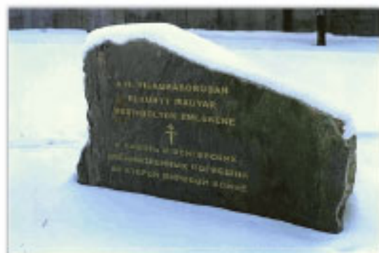
Памятный знак венгерским военнопленным.

Весной 2011 года в Рязани состоялся открытый конкурс на проект памятного знака рязанцам — жертвам политических репрессий, который должен быть установлен на территории Мемориального комплекса на улице Магистральной.