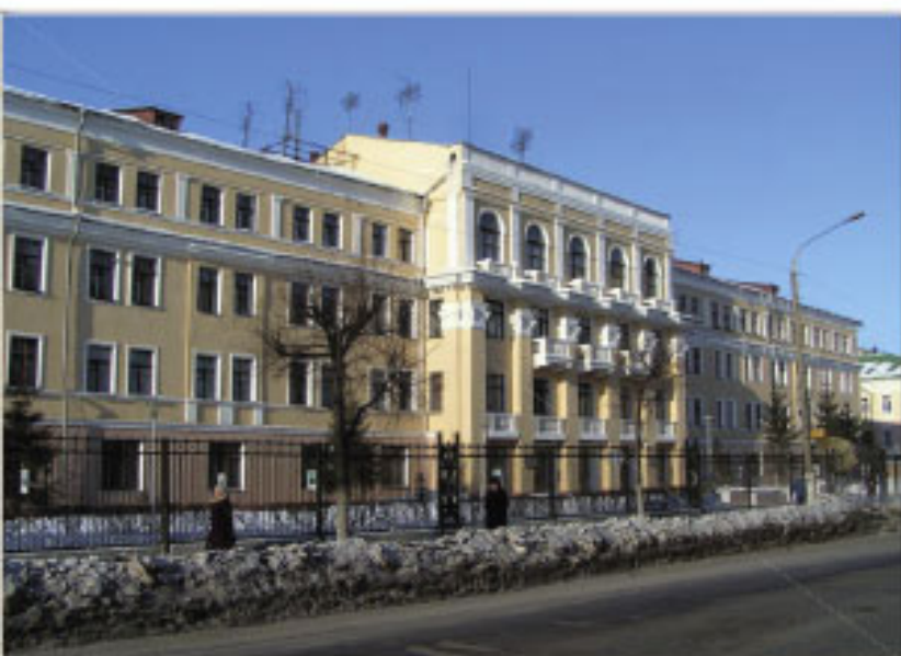
Территория бывш. Рязанского артиллерийского училища (РАУ)