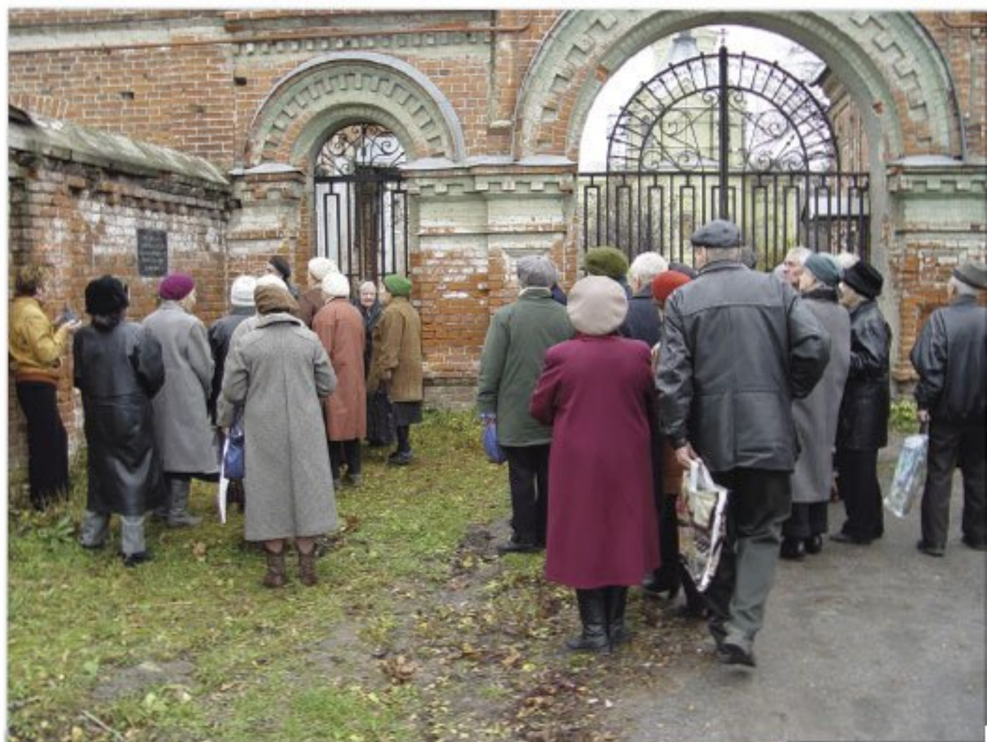
Стена памяти жертв террора у Старообрядческой церкви Рязани.

У входа на территорию Старообрядческой церкви Рязани 1 находится Стена памяти жертв коммунистического террора. На стене установлена памятная мраморная доска: « Это не должно повториться! В братской могиле за этой стеной покоится прах жертв политических репрессий 30-х гг. в Рязани. »